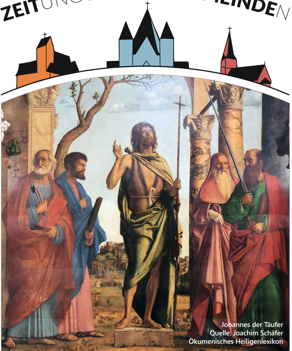
Johannes der Täufer