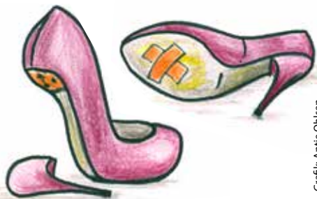
Grafik: Antje Ohlsen