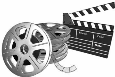
Grafik: Tony Hegewald_pixello.de